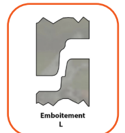
Tableau de réf. article