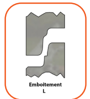
Tableau de réf. article