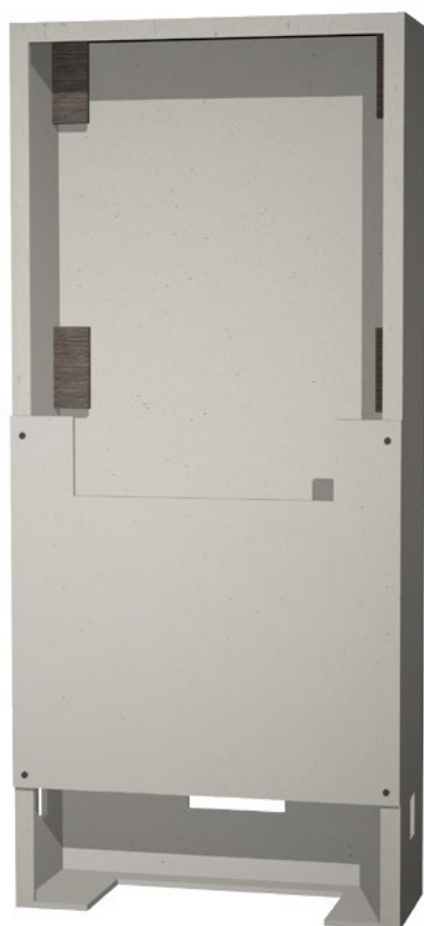
COFFRET S300 + SOCLE