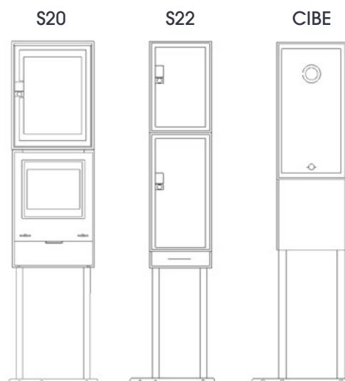
Dimensions en mm